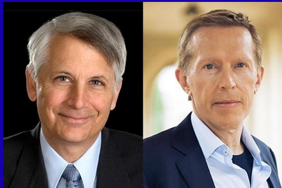
американские ученые Уильям Штраус и Нейл Хоу